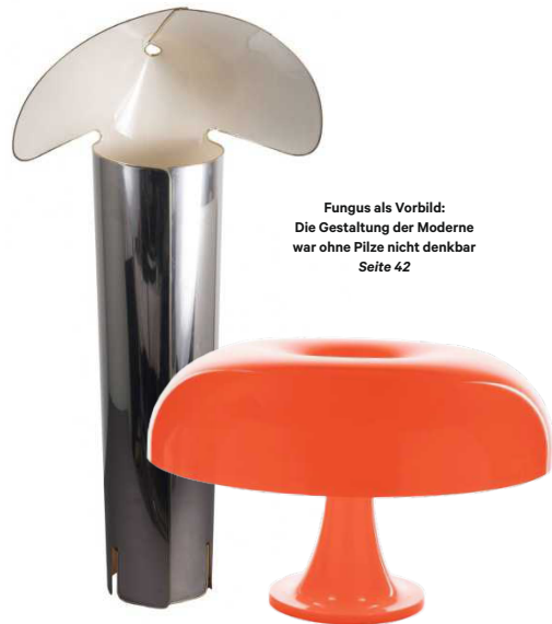
Fungus als Vorbild: Die Gestaltung der Moderne war ohne Pilze nicht denkbar Seite 42