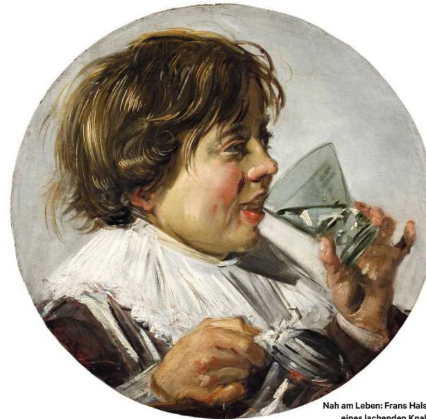
Nah am Leben: Frans Hals' »Brustbild eines lachenden Knaben mit Weinglas«, geschaffen um 1630 Seite 36

60 Alles so schön bunt hier Psychedelische Pilze erleben ein Revival. Auch die Wissenschaft schaut neu auf die halluzinogenen Drogen und ihre Gefahren