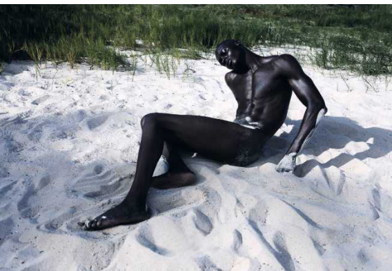
Ziemlich cooler Kunstort: Das Museum Fotografiska eröffnet eine Dependence in Berlin Seite 70