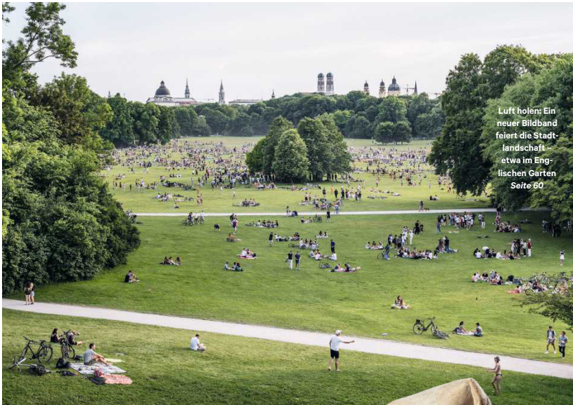
Luft holen: Ein neuer Bildband feiert die Stadtlandschaft etwa im Englischen Gärten Seite 60