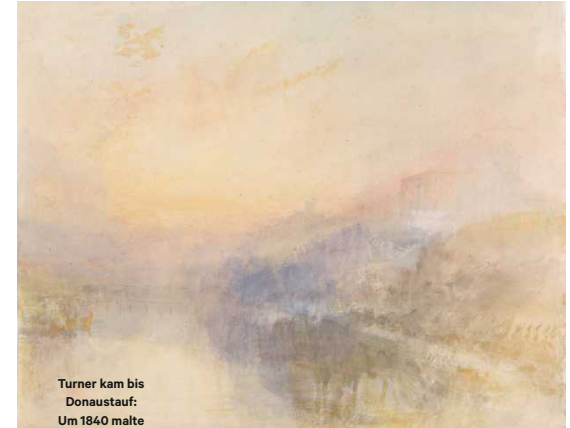
Turner kam bis Donaustauf: Um 1840 malte der Engländer die Walthalla Seite 22