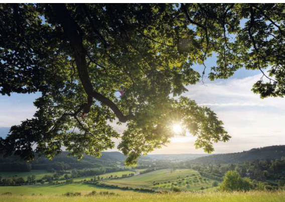
Die Schwäbische Alb lockt mit Blicken in die wildromantische Natur wie hier am Rappenberg Seite 54