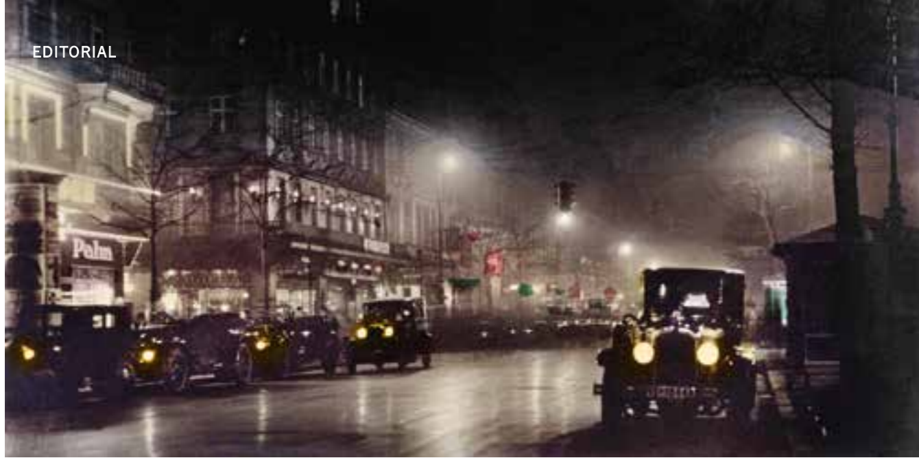
AUGEN DER NACHT: Die Berliner Friedrichstraße hat alle Lampen an. Kolorierte Fotopostkarte, um 1928