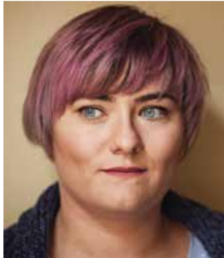
Psychogramm Lebensgefährtin Angst S. 44