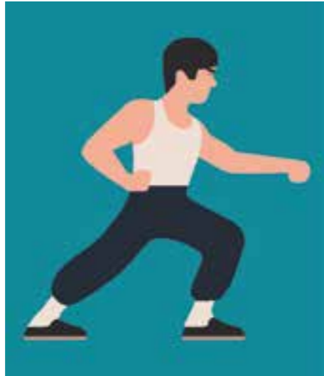
Crashkurs Digitale Selbstverteidigung S. 80