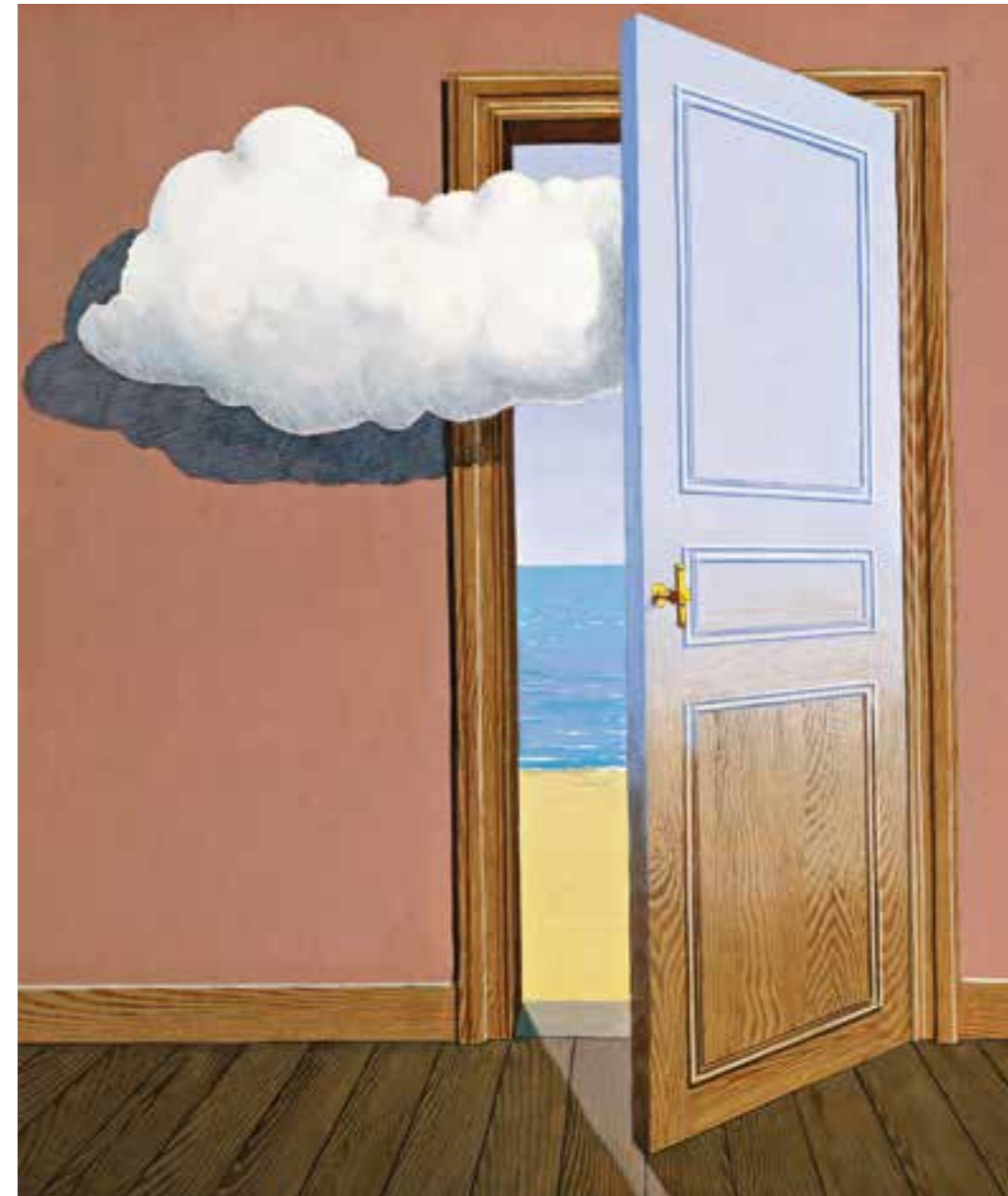
Abb.: René Magritte, Christies Images Ltd./Artothek

Fotos: Julian Baumann; Hartmut Nägele; Illustration: Adrian Johnson