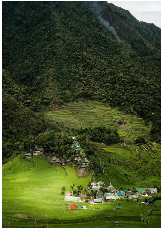
Seite 10 Auf den Philippinen forscht Vanessa Obermair nach der Geschichte einer Ahnenfigur. Findet sie eine Spur?