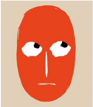
Quälgeist Das schlechte Gewissen S. 66