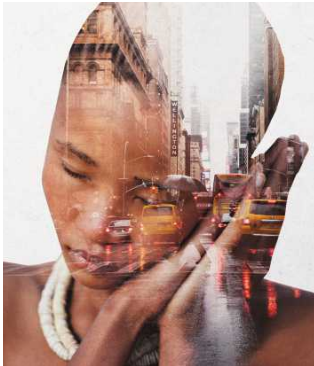
Altes Wissen Heute wieder aktuell S. 54