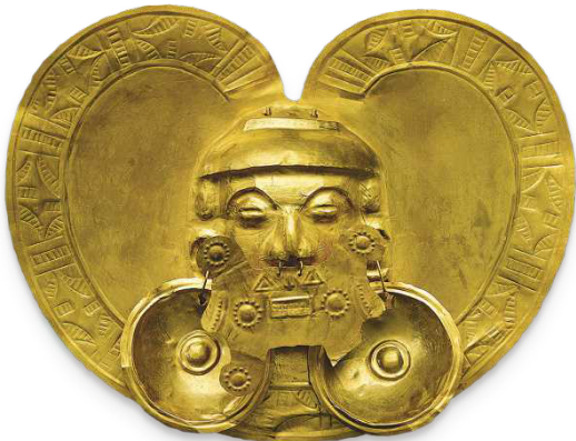
Kolumbien glänzt! In der Region Calima entstand die Brustplatte mit Gesicht aus einer Goldlegierung Seite 56