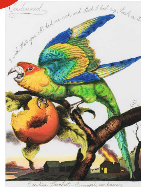
Ein Herz für Tiere hat Walton Ford, der 2006 »Condemned« malte Seite 20