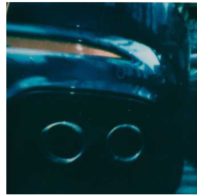
70 FAHRENDE FRAU Zackig im Maserati Grecale GT 74 KÖRPER Der Fuß hat mehr Aufmerksamkeit verdient