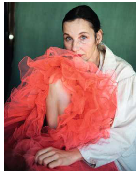
84 MERET BECKER Über die Männer ihres Lebens