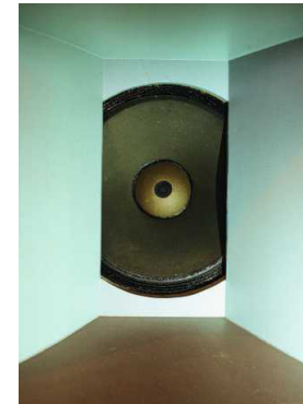
122 AUSGEHEN UND ZUHÖREN Der Boom der Listening Bars