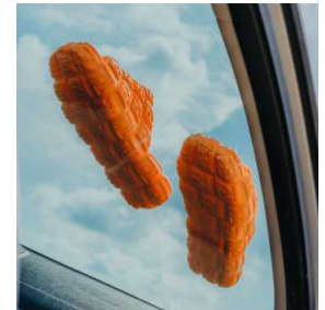
130 BADEMODE Am Strand von Fuerteventura 142 LISTEN DER SAISON Unsere besten Empfehlungen für den Sommer 146 REHAB Wie schön das Leben wäre mit einer Stunde mehr Schlaf!