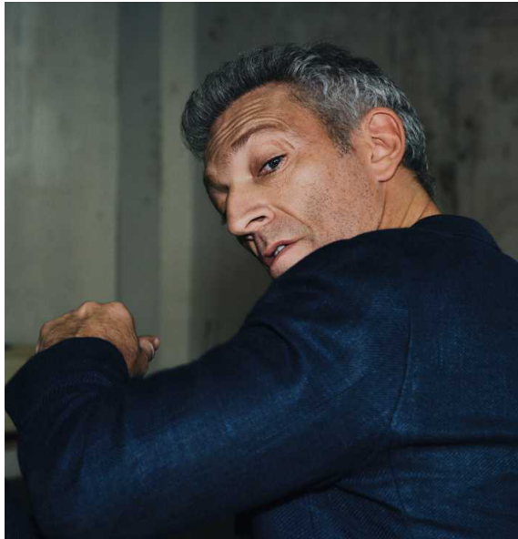
58 VINCENT CASSEL Über Intensität und Abwechslung