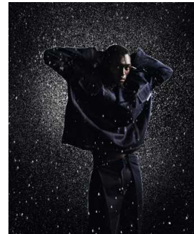
96 DAS BLAUE WUNDER Jeans sind toll und passen gut zu Jeans