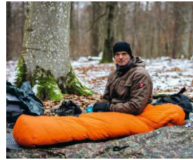
76 WALDMENSCH Eine lange, kalte Nacht unter Bäumen