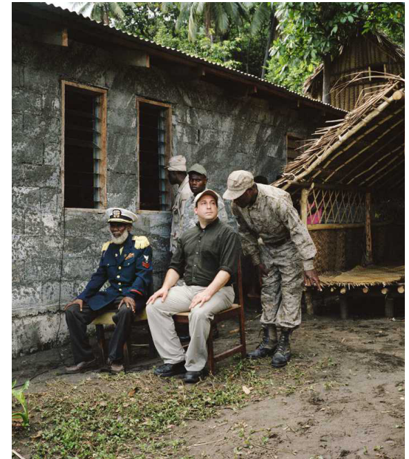
112 ERLÖSER GESUCHT Der Kult-Tourismus auf einer Pazifikinsel