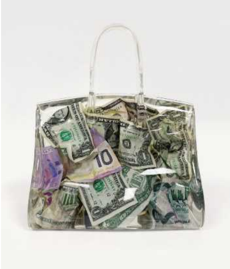
Handel Wie global darf er sein? S. 38