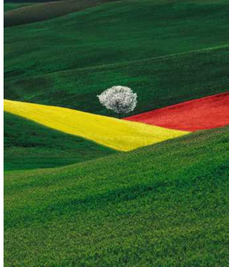
Landschaft Verbindung mit der Seele S. 86